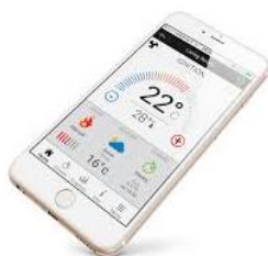
App di gestione