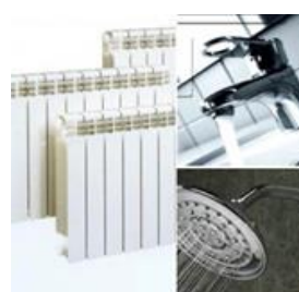
Riscaldamento / ACS