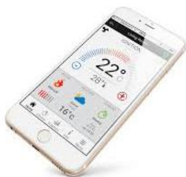
App di gestione

(*) dipendente dal grado di isolamento dell'edificio e dalla qualità del combustibile (% umidità)