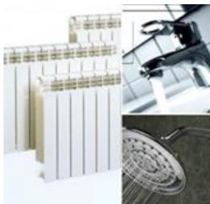
Riscaldamento ed ACS