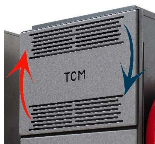
Funzione Air Plus