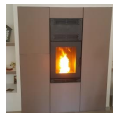
Esempio di rivestimento