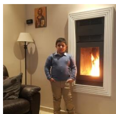
Esempio di rivestimento

Lo scambiatore secondario (optional) in rame certificato ad uso idrotermosanitario garantisce elevata, istantanea e prolungata produzione di acqua sanitaria (fino a 15 lt/min.) su tutti i servizi dell'abitazione cucina, bagni, lavanderia, servizi, ecc.