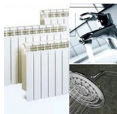
Riscaldamento ed ACS