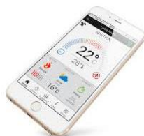
App di gestione