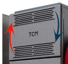
Funzione Air Plus