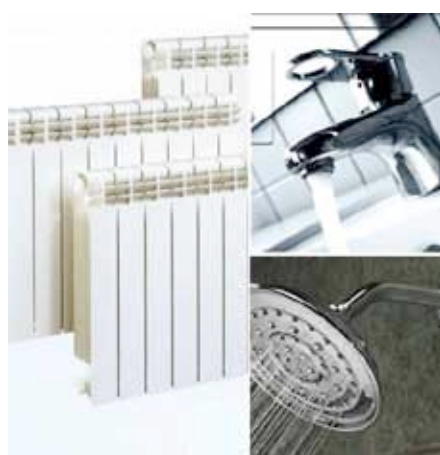
- Riscaldamento e produzione Acqua calda sanitaria

L'intera gestione e controllo della caldaia è totalmente elettronica digitale per un'elevata sicurezza ed affidabilità, nonché per rendere semplice ed immediata la gestione/conduzione della caldaia anche agli utenti meno esperti