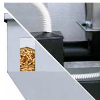
- Elevata autonomia Massima sicurezza (doppia coclea)