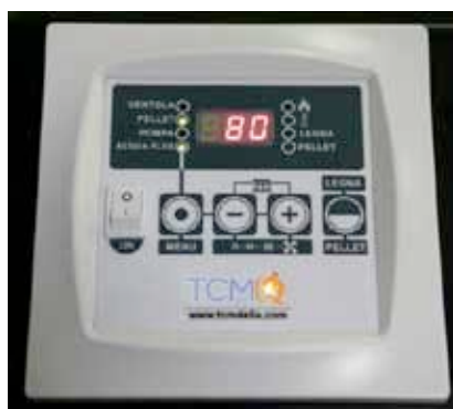
- Gestione totalmente elettronica