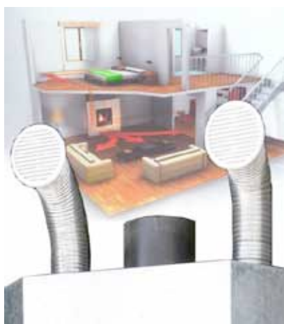
- Sistema di diffusione aria calda in tutti i locali della casa