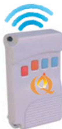
- Telecomando elettronico potenza aria