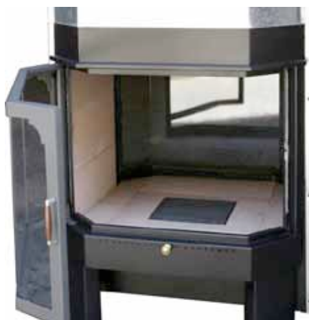
- Vista fuoco dai due lati - Camera di combustione in refrattario e ghisa

E' dotato di serie del cassetto raccogli cenere che consente, attraverso la griglia in ghisa posta al centro del piano fuoco, una rapida raccolta ed un comodo smaltimento delle ceneri residue della combustione nel minor tempo possibile e senza ricorrere continuamente ad ulteriori attrezzature a supporto di tale attività